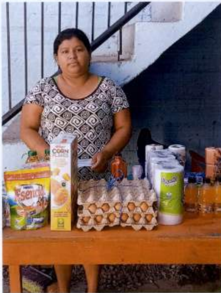
Foto: Madre del niño recibiendo regalo